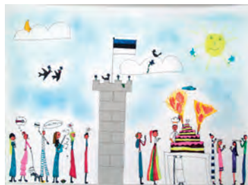
Kirke, 1T klass