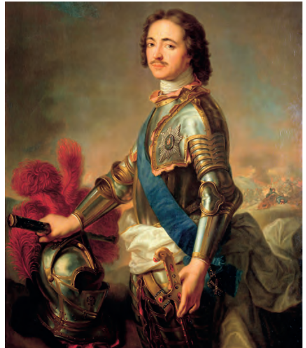
Peeter I, Vene tsaar aastatel 1682–1721 ja Vene keisririigi keiser aastatel 1721–1725.

Kunstnik Jean-Marc Nattier, maalitud u 1718.