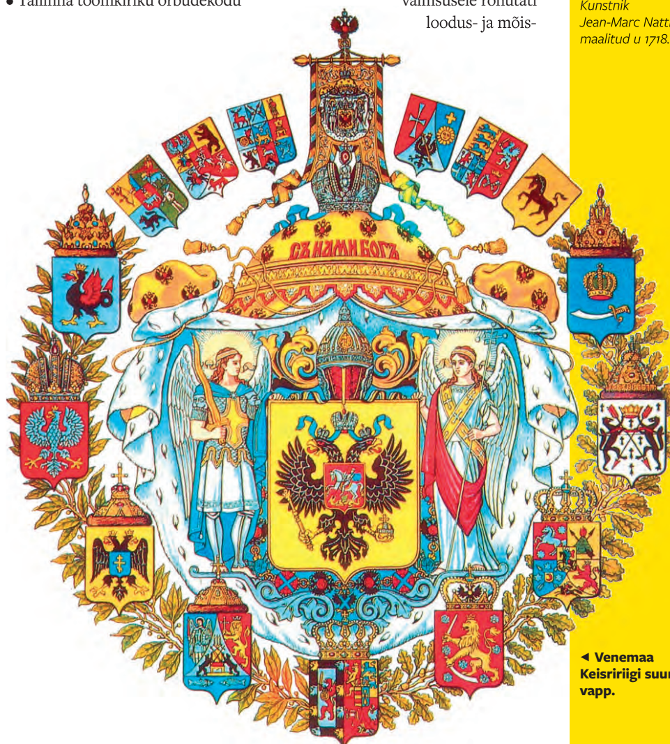
◀ Venemaa Keisririigi suur vapp.